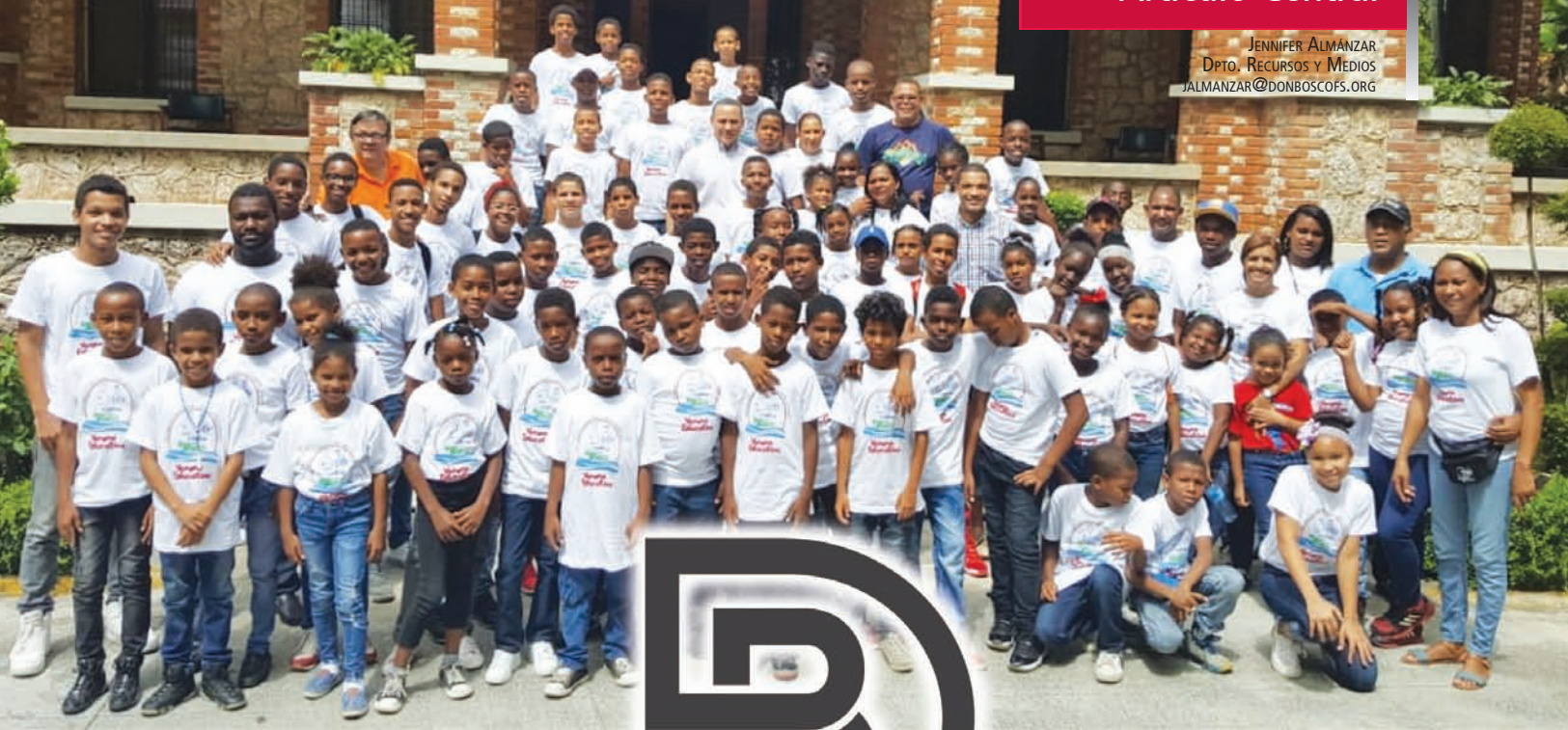
Visita de la Obra Canillitas con Don Bosco a la Inspectoría Salesiana y la Fundación Salesiana Don Bosco.