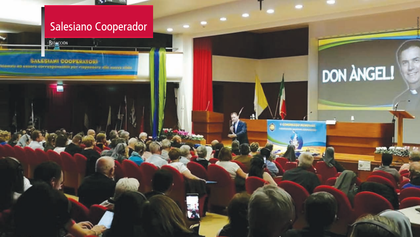
El Rector Mayor en el Congreso Mundial de los Salesianos Cooperadores