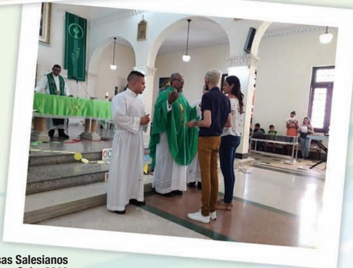
P. Inspector en las promesas Salesianos Cooperadores, Cuba 2018