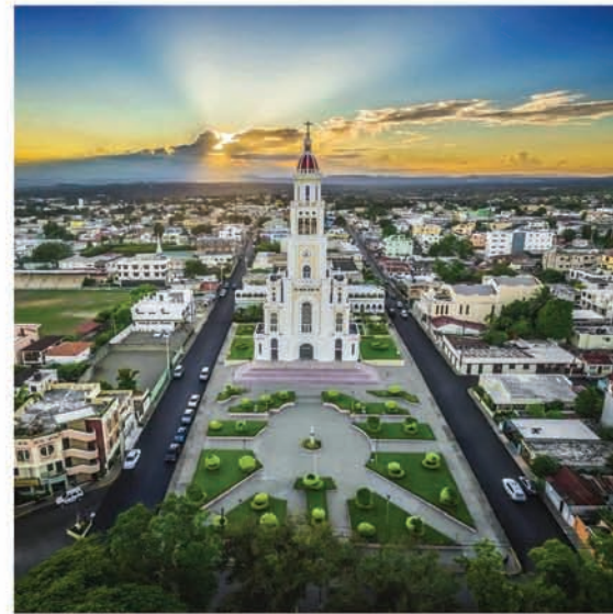
Hermosa imagen del Santuario Sagrado Corazón de Jesús Moca, República Dominicana