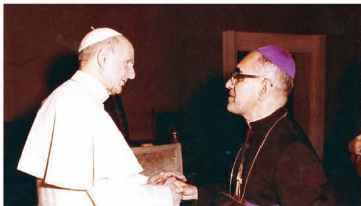
El papa Pablo VI junto al Obispo Oscar Arnulfo Romero, ambos Canonizados el 14 de octubre del 2018 por el Papa Francisco

En 1978 se dirigió a los salesianos del XXI Capítulo general: “Sean bendecidos... Llénense de las gracias que el Señor les desea lo mejor... Sean verdaderamente salesianos! Entre las muchas reuniones nos conmueve de una manera especial y nos da la alegría y esperanza que la Iglesia de hoy sea verdaderamente la Iglesia de Don Bosco, una Iglesia viva” ✠